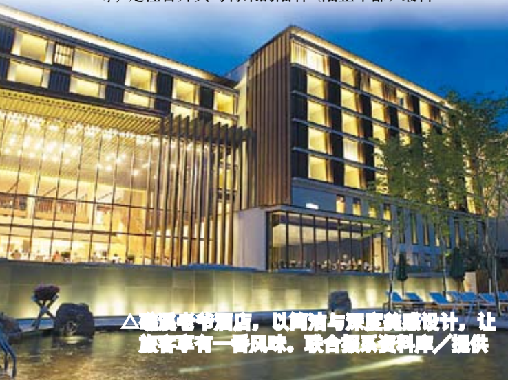
△晶华酒店，以简朴与深邃美感设计，让旅客享有一番风味。