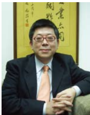
台湾经济日报总经理