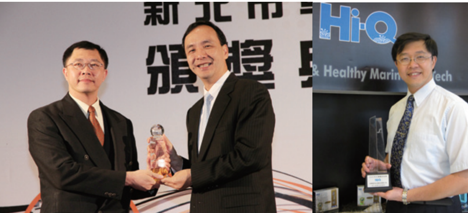
▲ 新北市長朱立倫（右）與中華海洋生技總經理戴章皇合影。

委會水產試驗所「獨家技術授權與 Hi-Q 中華海洋生技『產學合作』，採用海洋巨大褐藻，以「搶救荒原、再現輝煌」為目標，在植栽最為困難的天然褐藻中之「褐藻醣膠」，成為暢銷海洋健康食品「小分子褐藻醣膠」。Hi-Q 榮獲臺灣外貿協會頒發 2009「臺灣優良品牌」及生策會頒發 2010、2011「SNO 國家品質標章認證」。