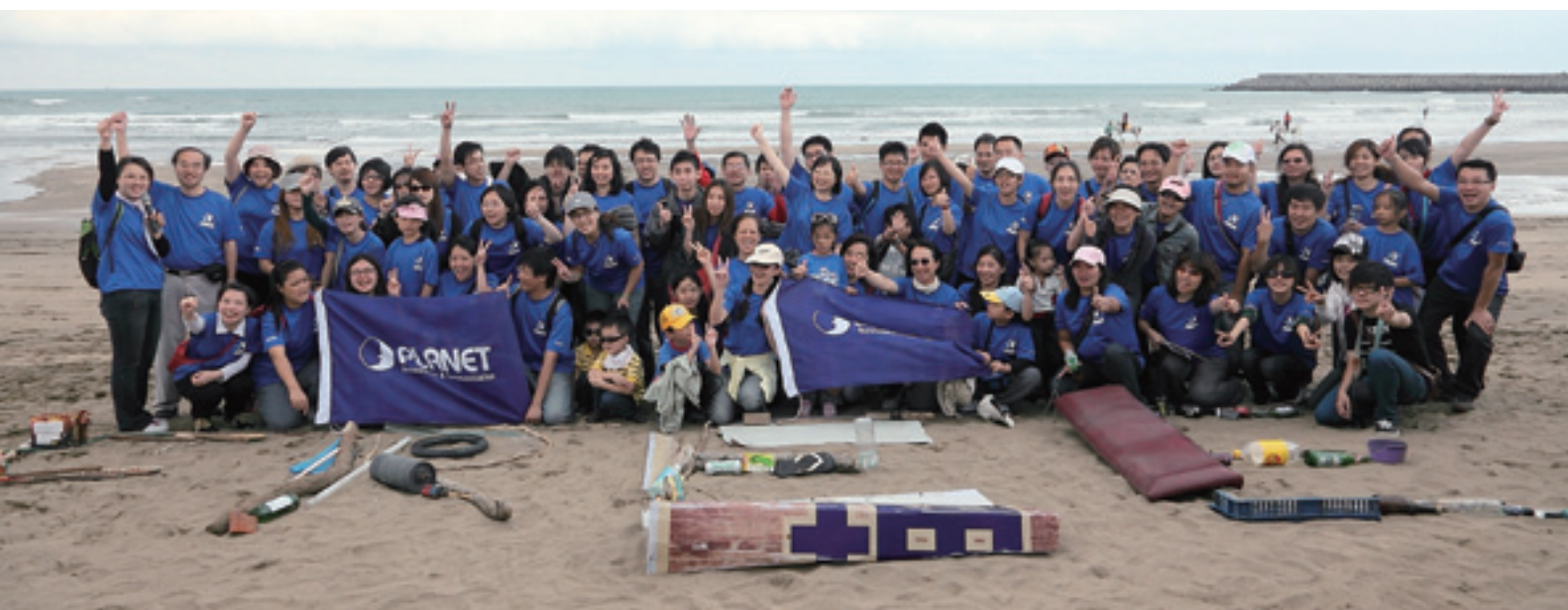
▲ 普萊德科技帶領企業志工參與 2011「國際淨灘」活動。