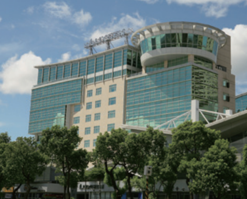
▲ 位於新北市新店區的「裕隆生活城」，大幅的提昇新店地區的生活機能與繁榮。