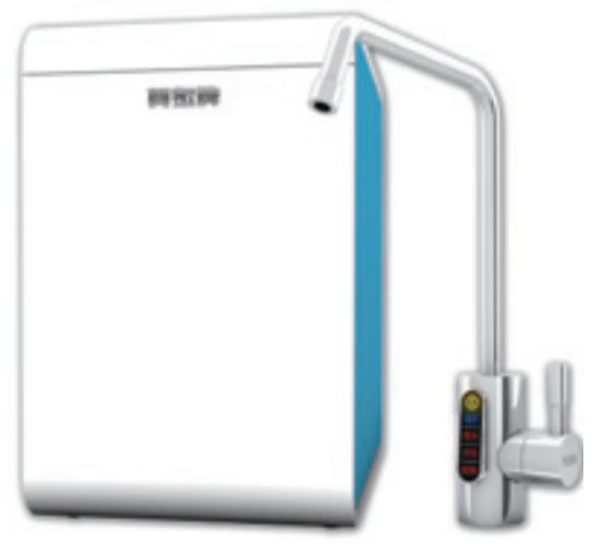
▲ 廚下輕巧型逆滲透淨水器 (UR-5802JW-1)