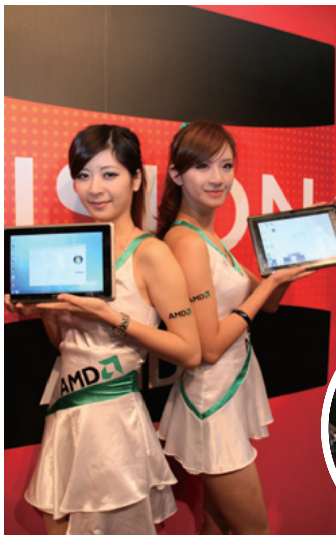
▲ 微星所推出的平板電腦 MSI WindPad 110W