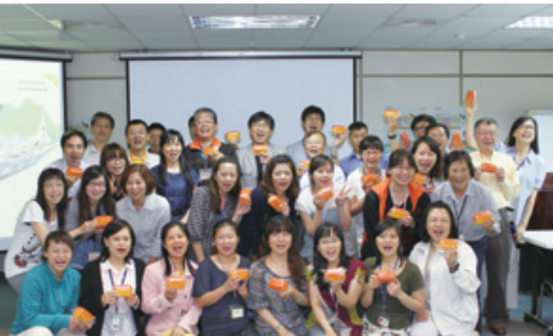
▲ 英華達關懷台灣世界展望會國內貧童教育，自2009年起擴大參與助學行動，為台灣各地經濟弱勢家庭的孩子募集助學金。

英華達無論在產品研發或助弱濟貧的社會公益，都從利他角度出發，真正實踐了「施比受更有福」的核心價值。