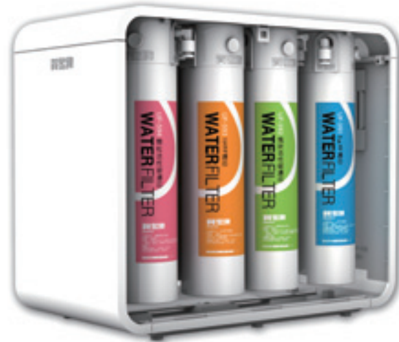
▲ 採用最新開發 Quick-Fit 卡式濾芯，DIY 更換超輕鬆。

遠地區學校，無不顯露賀眾對台灣土地擁有的深厚情感，賀眾就像健康純淨的飲水一般，永遠是值得信賴的好朋友。●