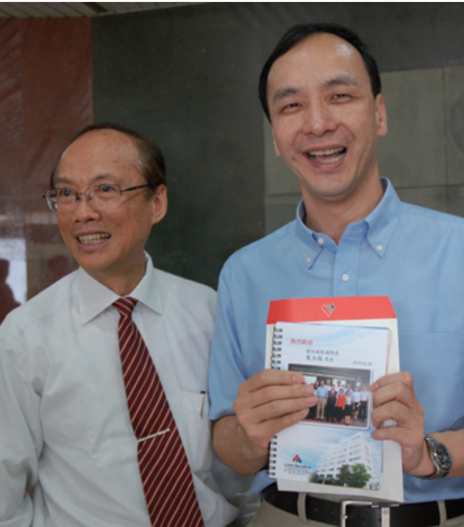
▲ 洪文來總經理致贈運用數位印刷設備製作之朱立倫市長(右)專屬個性化筆記本。