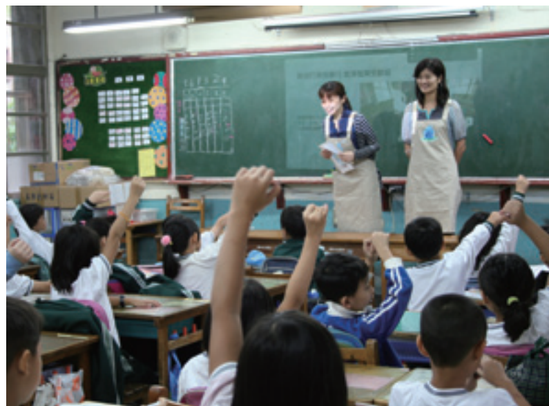
▲ 花王志工教導三年級小朋友如何聰明做打掃。