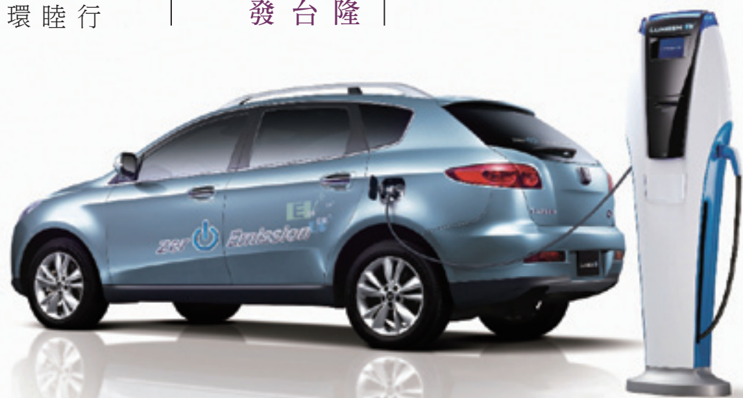
▲ 裕隆集團結合旗下資源，將一同為台灣的電動車產業發展及建立低碳家園共同努力。

資產，裕隆順應全球環保節能趨勢，積極推動符合減碳趨勢的智慧電動車，讓汽車產業躋身新興的綠能產業，並持續實踐企業社會責任，讓裕隆能以台灣為出發點，面對國際的競爭與挑戰，創造長遠的競爭優勢與利基，朝向國際化的目標邁進。