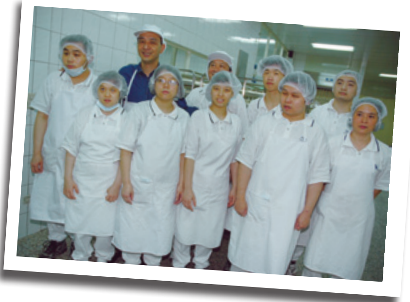
▲ 新北市長朱立倫（後排左二）與大玉成身障員工合影。