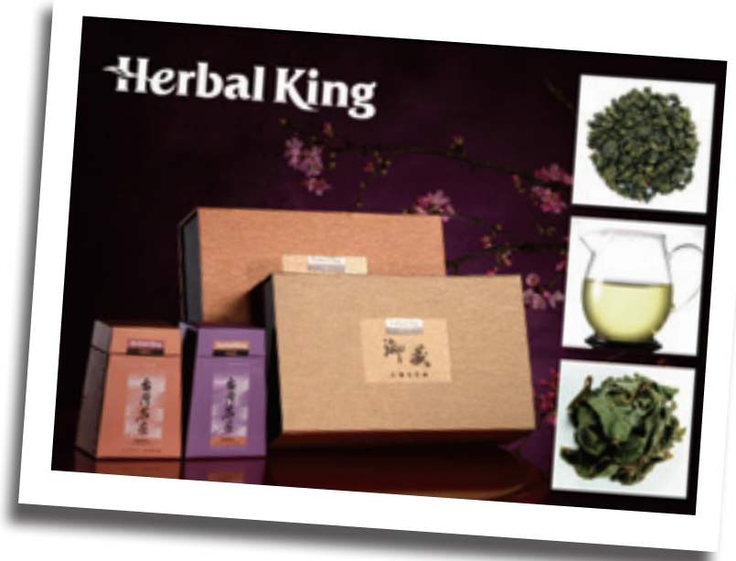
▲ 禾勃王榮獲世界茗茶評比金質獎，並獲選為兩岸交流國賓贈禮。