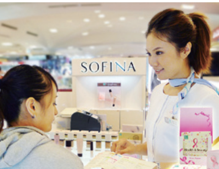
▲ Kao Pink Ribbon 粉紅絲帶活動推廣，喚起女性朋友關懷自身健康。

會，共同投入 Kao Pink Ribbon 粉紅絲帶乳癌防治宣導活動，透過花王（台灣）蘇菲娜的美容師們，佩戴粉紅絲帶徽章，針對她們所接觸到的女性顧客發送乳癌防治宣導小手冊，宣導早期發現乳癌的重要性以及自我檢查的方法，使更多的台灣婦女多關心自己的身體狀況，提供許多女性便利的健康諮詢管道，對於女性健康與衛生教育貢獻卓著。