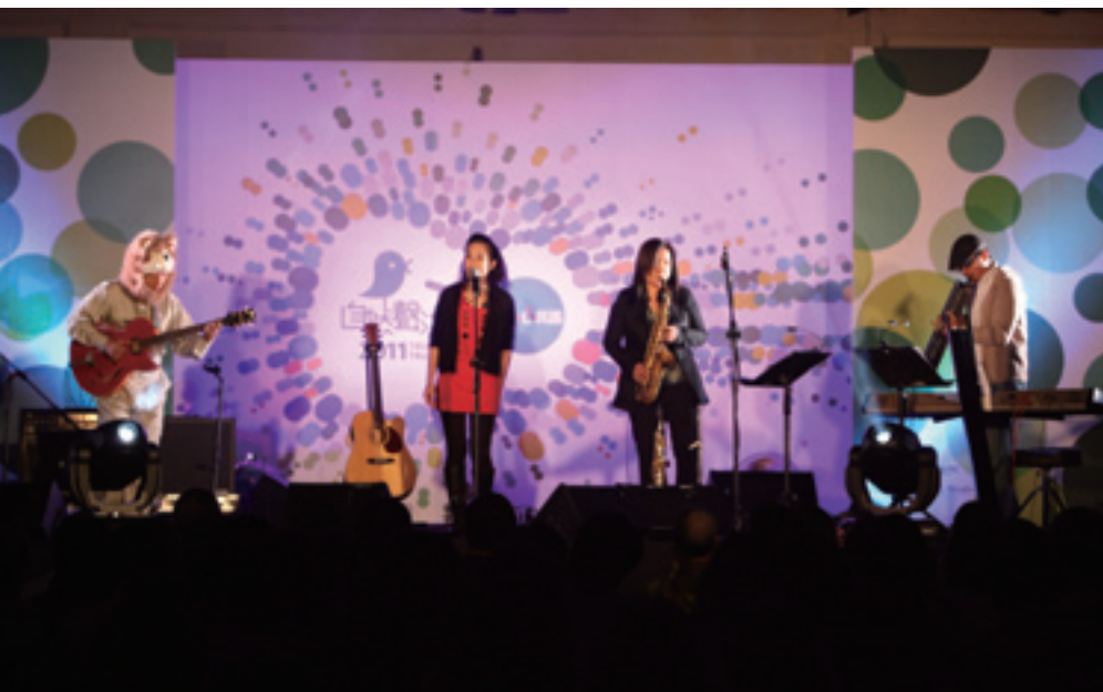
▲ 舉辦自然聲活節活動，以莉·高露與樂手呈現出自然的樂風。