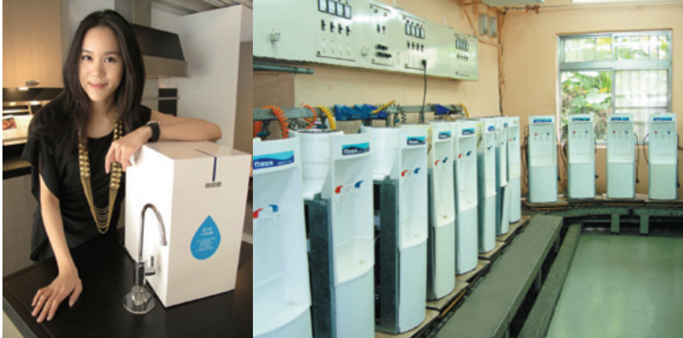
▲ 採訪人物 - 王艾苓特助。