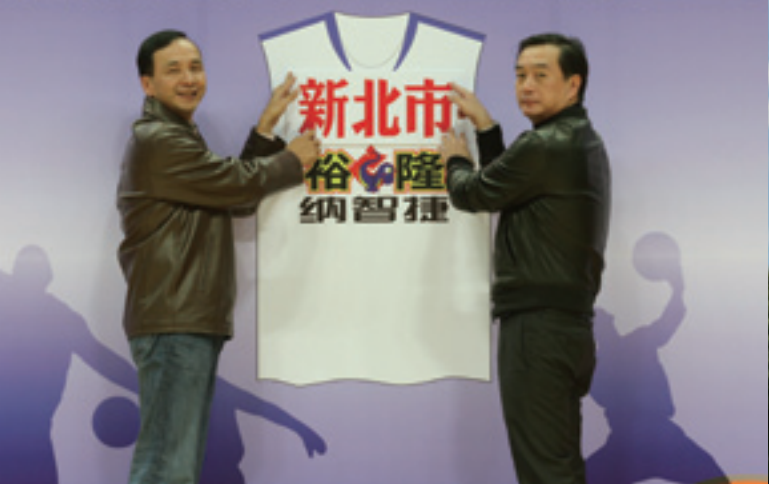
▲ 裕隆成為全國第一支冠上城市名稱的籃球隊伍。