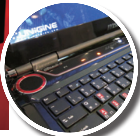
▲ 微星和知名喇叭品牌 Dynaudio 合作確保聲音品質。

社會局為境內單親家庭捐贈五十部筆記型電腦。除了金錢資助，重視綠色環境的微星，多年來認養新北市中和區路樹，希望能藉此提升當地環境品質與居民的居住水準，另外，也贊助中和地區義、消、警隊，回饋鄉里，對地方社會公益貢獻良多。