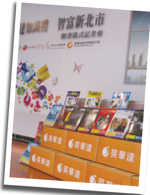
▲ 英華達將旗下繁星出品英語學習相關書籍五萬本，價值約新台幣九百多萬捐贈給新北市立圖書館。