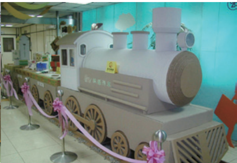
▲ 紙藝展覽推出正隆公司的「春風紙藝列車」，兼具紙藝和環保。